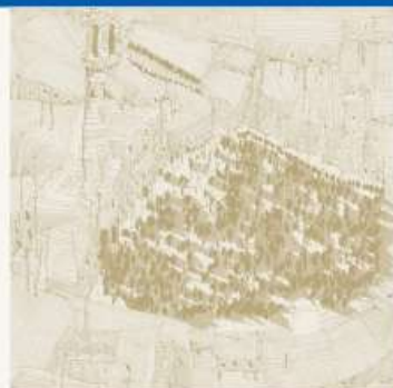
Matteo Boato, Siena, Piazza Olio e grafite su tela, 100 x 100 cm, 2008

Giannantonio Scaglione è assegnista di ricerca presso il Centro Geo-Cartografico di Studio e Documentazione (GeCo) dell'Università degli Studi di Trento. Ha conseguito il titolo di Dottore di Ricerca in Storia della cultura, della società e del territorio in età moderna presso l'Università degli Studi di Catania. È stato vincitore del Project Work Innovazione (2011), del programma internazionale XIII Executive Programme for Cultural Collaboration between Malta e Italy (2014) e del progetto PhD Talents, Imprese e Dottori di Ricerca (Fondazione CRUI, M.I.U.R. e Confindustria) (2017). Ha pubblicato il volume Le carte e la storia. Cartografia tematica della città di Catania in età moderna (2012) e Malta e La Valletta. Città, uomini e territorio tra XVI e XVIII secolo (2017). Al momento conduce una ricerca sui processi di formazione delle identità urbane e territoriali.